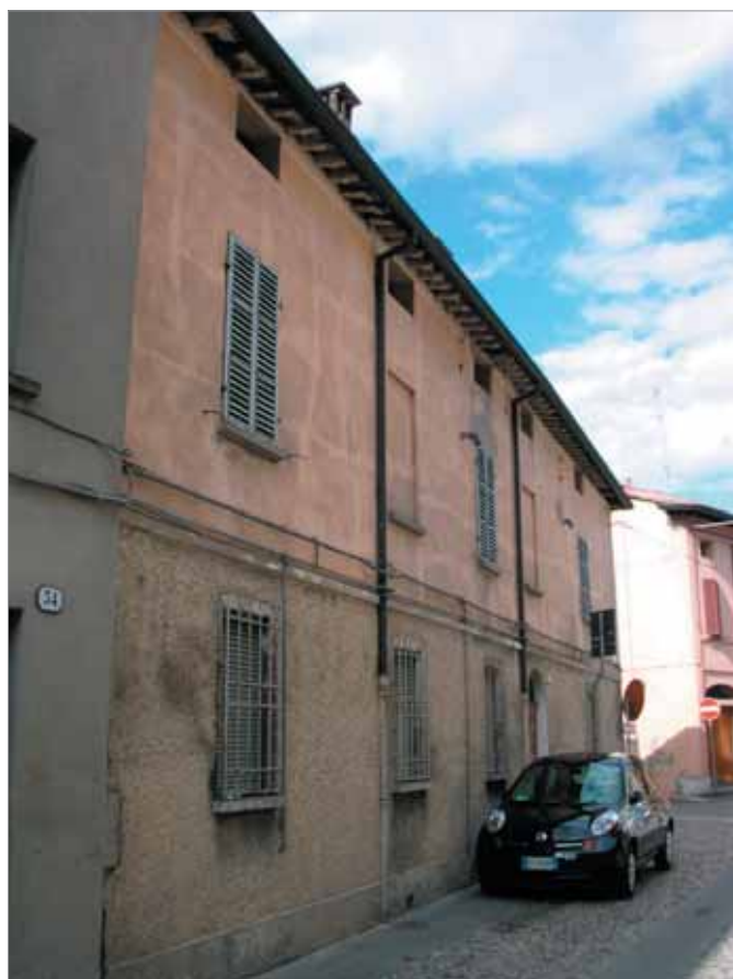
Via Battisti 32 Fronte Principale